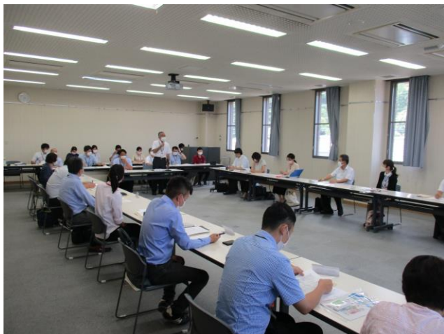
日南串間成年後見ネットワーク協議会（会議の様子）

これまで同様、地域包括支援センター等の権利擁護相談窓口が1次相談の機能を担います。福祉課1名と長寿課1名の職員はこれまで同様に兼務で担当します。